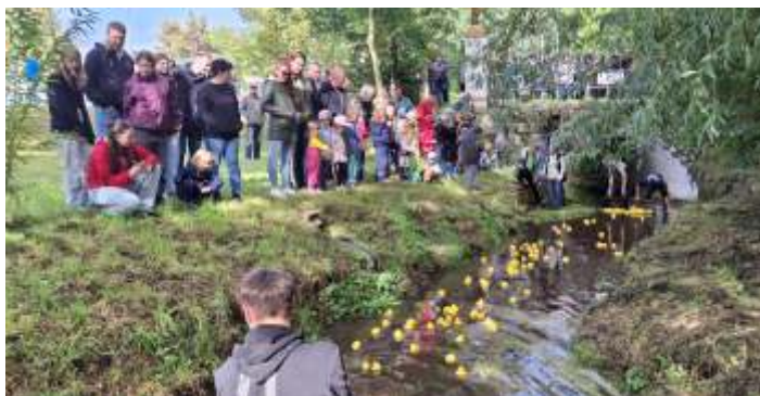
Herbstfest 2025, weitere Bilder im Innenteil