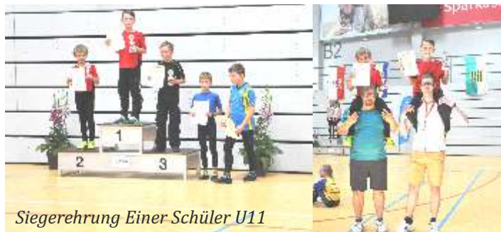
Siegerehrung Einer Schüler U11